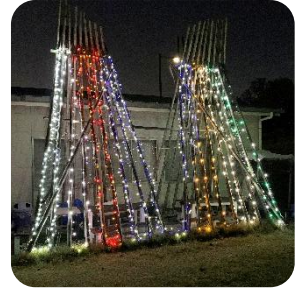
クラブハウス イルミネーション