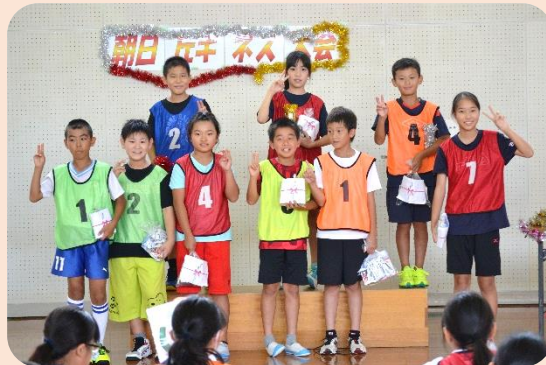
コロナで3年間ギネス大会ができなかったため 2019年度の受賞者の写真です♪