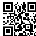
朝日丘スポーツクラブ ホームページ QR コード